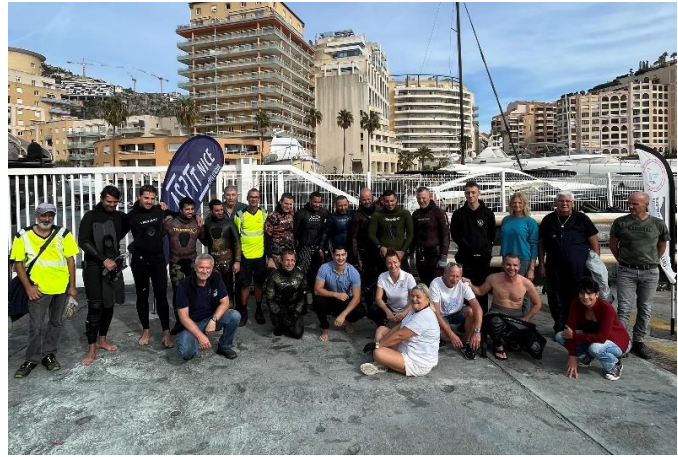
Port de Cap d'Ail