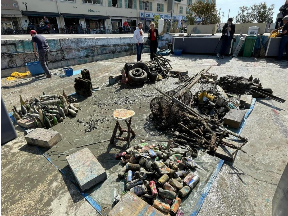
Grand tri sur la cale de halage du port de Nice