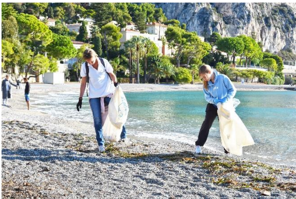
Plage de la Petite Afrique, Beaulieu-sur-Mer