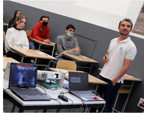
Journée Défense et Citoyenneté – Caserne Filley, Nice