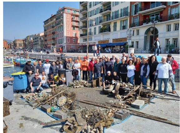
Port de Nice