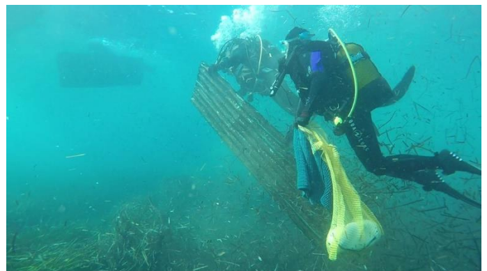
Déchets de chantier, Citadelle de Villefranche-sur-Mer